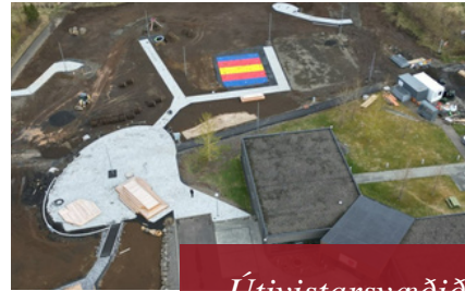
Útivistarsvæðið í Melahverfi