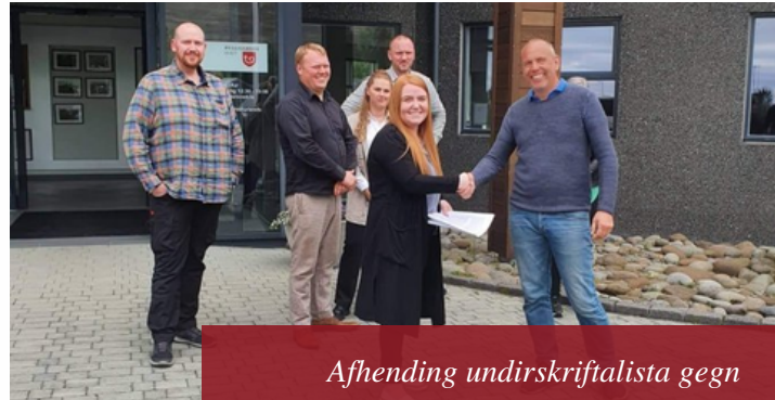
Afhending undirskriftalista gegn vindmylluframkvæmdum í landi Brekku.

Sveitarstjórn vill óska öllum velfarnaðar í leik og starfi á haustmánuðum.