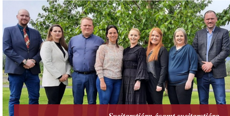
Sveitarstjórn ásamt sveitarstjóra.